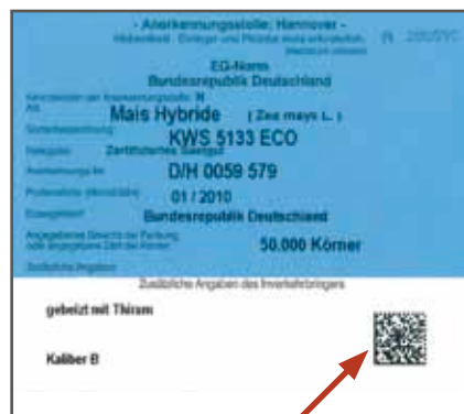
▲ Nyugat-európai csomagolás esetén az azonosító a zsák címkején található!

A hazai kereskedelemben már jól működő BÁRKÓD rendszer fejlesztése folyamatos. A cél, hogy a mai információs technológia világában kitűnően működő "okos telefonok" segítségével azonnal beazonosítható legyen minden egyes lecsomagolt vetőmag tétel, kizárva ezzel a hamisítás tényét!