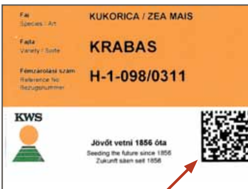
▲ Belföldi csomagolás esetén az azonosító a zsák alján található!

A rendszer bevezetése a hazai piacra már a 2010-2011-es téli szezonban megkezdődött, így a tavaly értékesített vetőmag zsákokon a gazdálkodók már találkozhattak a megkülönböztető matricával.